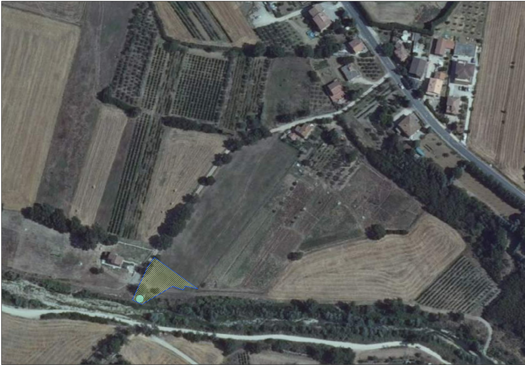
INQUADRAMENTO SU ORTOFOTO AREA IMPIANTO